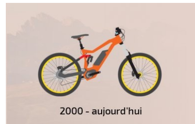
2000 - aujourd'hui