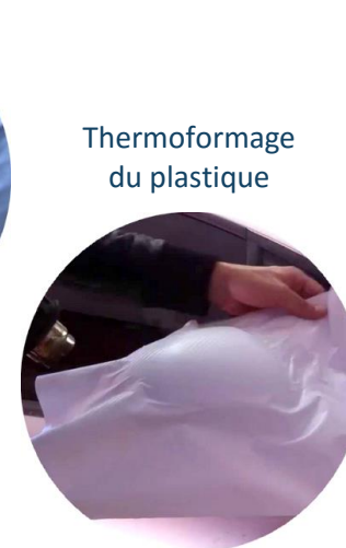
Thermoformage du plastique