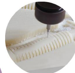
Usinage matériau composite